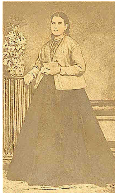
Narcisa de Jesus Martillo y Mórán

– Site do Vaticano: http://www.vatican.va/news_services/liturgy/saints/2008/ns_lit_doc_20081012_narcisa_en.html